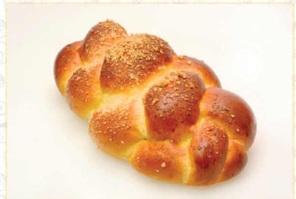
CHAŁKA BERGISBROOFJE gramatura gewicht poids 300 G