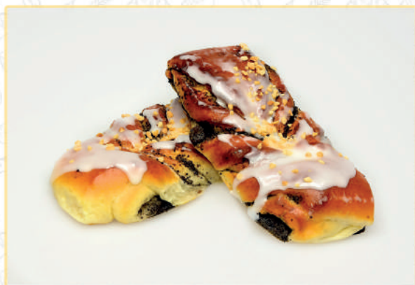
BUŁKA Z MAKIEM BRIOCHE AVEC PAVOT - gramatura - gewicht - poids 90 G