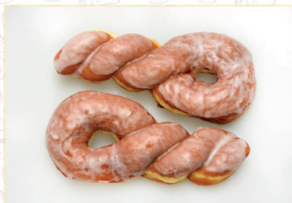
ŚWIDEREK BEIGNET AVEC DU GLAÇAGE - gramatura - gewicht - poids 90 G