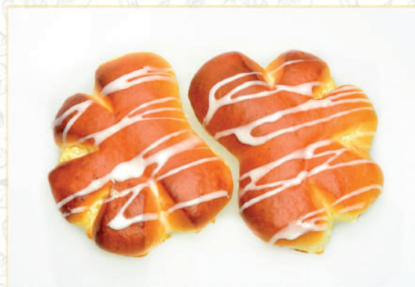
BUŁKA Z SEREM BEIGNETS AVEC DU FROMAGE - gramatura - gewicht - poids 90 G