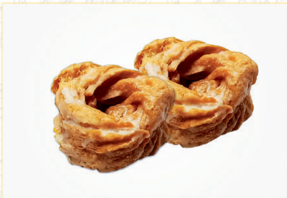
GNIAZDO DONUTS gramatura gewicht poids 90 G