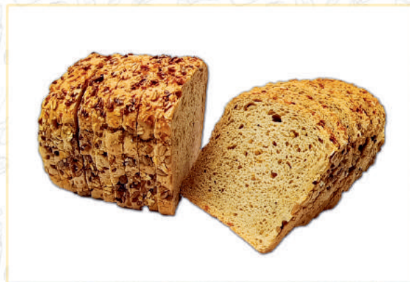
CHLEB Z ZIARNEM

krojony/niekrojony gesneden/ongesneden découpé/non coupé