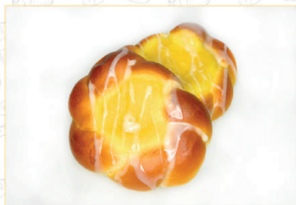
BUŁKA Z BUDYNIEM BRIOCHE AVEC DU PUDDING - gramatura - gewicht - poids 90 G